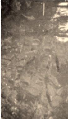
二庄内ダムの全貌 カラーでないのが残念ですが、素晴らしい風景でしょう。釣れなくても雰囲気だけで充分。

温泉場で戯れる小ペラ達 二庄内温泉から流れ落ちる水路に戯れる小ペラ軍団! へら運も温泉が好きなんではないかな。気持ちよさそうに泳ぎまわってるからね。