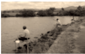
【八郎瀧飯塚大排水河口】

昨年の秋号で取り上げてますね。ご紹介した通り、昨年晩秋に7寸前後1トンの放流で、連日皆さんを楽しませてくれており、ここは平野部でありながら、乗っ込みが6月下旬から7月上旬なんです。この日は15名の例会が開催され、ほとんどがパンパンの抱卵魚で、トップは16kg、2着13kg、3着11kgで、平均釣果8kg台と、完全に昔の良さ釣り場に戻りました。