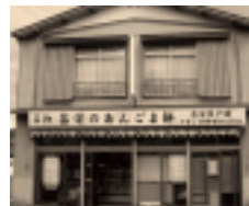
【名物昌栄のあんこ餅】

当店から10分、「あんこ・ごま・あんごま」の3種類で、日持ちするし、硬くならないのも良いなあ。