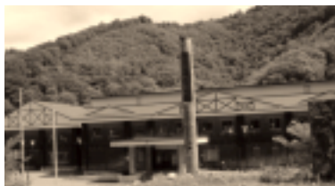
【国民宿舎 森吉山荘の湯】

自宅で食べる「ソーメン」はさほど美味しいと思わないのだが、釣り場で食べる「ソーメン」は(特に暑い日)美味しく何杯でも入っちゃいます。