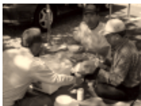
【夏はソーメン一番!】

当店から10分、「あんこ・ごま・あんごま」の3種類で、日持ちするし、硬くならないのも良いなあ。